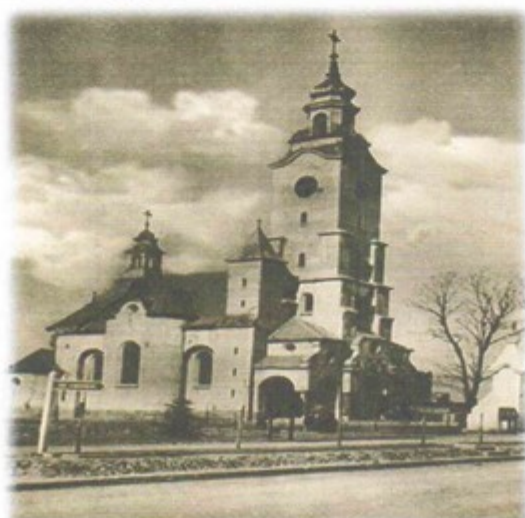
Stryków (Wielkopolska) Kath. Kirche